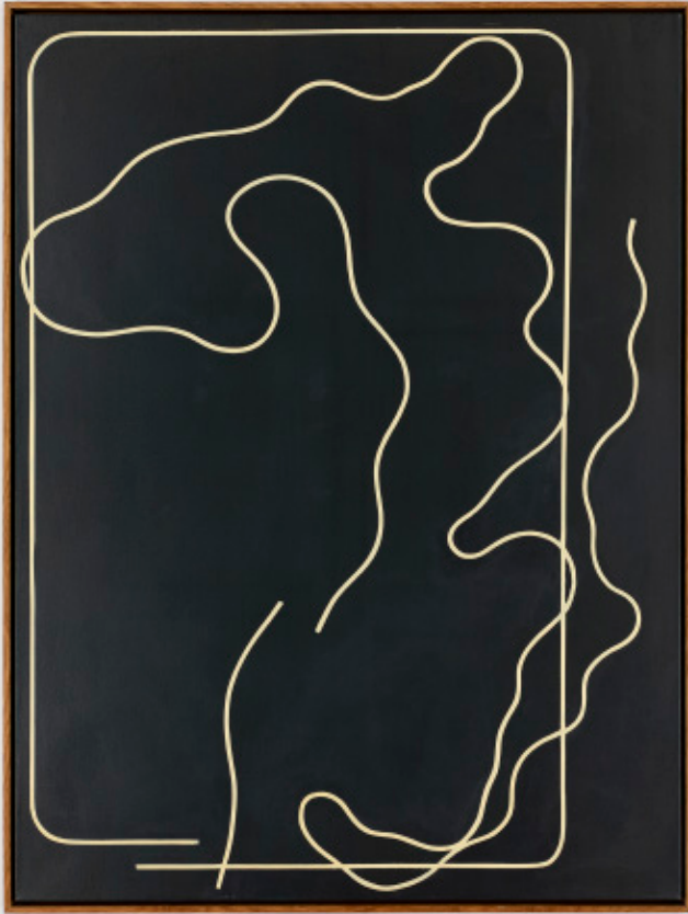
Sebastian Koch, O.T., 2020.

Der Eintritt zu allen Veranstaltungen ist mit gültigem Ausstellungsticket frei (4 EUR / 3 EUR ermäßigt, Eröffnungen sind grundsätzlich unentgeltlich).