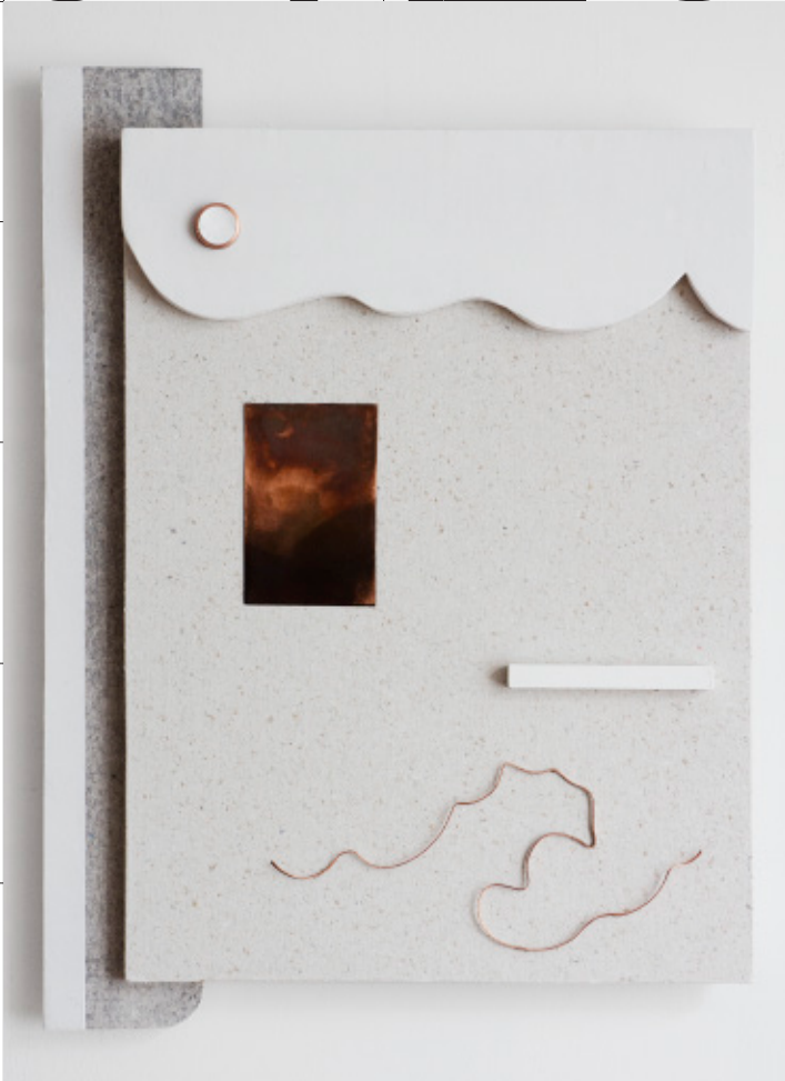
Melanie Ender, „Nr. 4 composition“, 2020

Melanie Ender *1984 in Wien | 2006–2013 Universität für angewandte Kunst, Akademie der bildenden Künste Wien | 2019 Nominierung für den Kardinal König Kunstpreis | Ausstellungsbeiträge u. a. im Belvedere 21 und im MAK | Residency Programme in Istanbul, Turin und Rom.