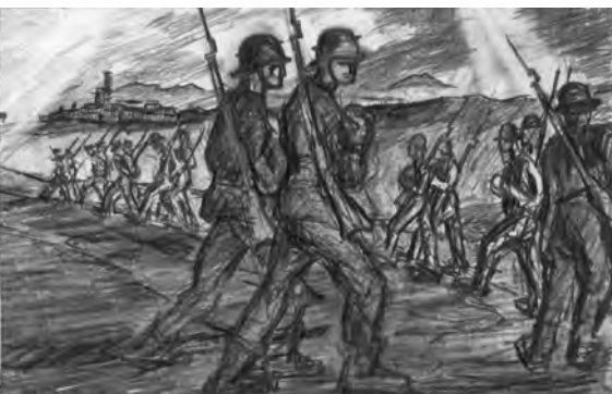
Stephanie Hollenstein, Exerzierende Soldaten , Bleistift und Buntstifte auf Papier, 1916