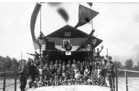
Siegesfeier an der Rheinbrücke nach der Eroberung von Warschau im August 1915

2014 ist es genau 100 Jahre her, seit die europäische „Ur-Katastrophe des 20. Jahrhunderts“, der Erste Weltkrieg, vom Zaun gebrochen wurde. Der Beginn des Krieges, der rund 17 Millionen Menschenleben forderte, jährt sich zwar erst Ende Juli, doch schon seit Jahresbeginn beliefern uns Buchautoren, Zeitungsfeuilletons und Fernsehsender mit so ziemlich allem, was es über diesen von Mitteleuropa ausgehenden und schließlich die ganze Welt erfassenden Krieg zu erzählen gibt.